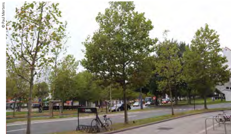
L'utilisation de biostimulants, comme le propose Compo Expert, permet de garantir une reprise des arbres lors de leur plantation (ici, un arbre sur deux a reçu des engrais avec biostimulants).

La fosse de plantation joue un rôle déterminant pour la viabilité de l'essence plantée. Son calibrage dépend du milieu dans lequel elle s'installe. Dans un milieu hostile, comme celui